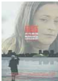
Os intérpretes son personaxes reais

O documental segue a vida do presidente chileno Salvador Allende desde a súa infancia en Valparaíso ata o suicidio o 11 de setembro de 1973, durante o golpe de estado militar que elevou ao xeneral Pinochet, a través de documentos de arquivos, álbums de fotos e entrevistas aós que o coñeceron.